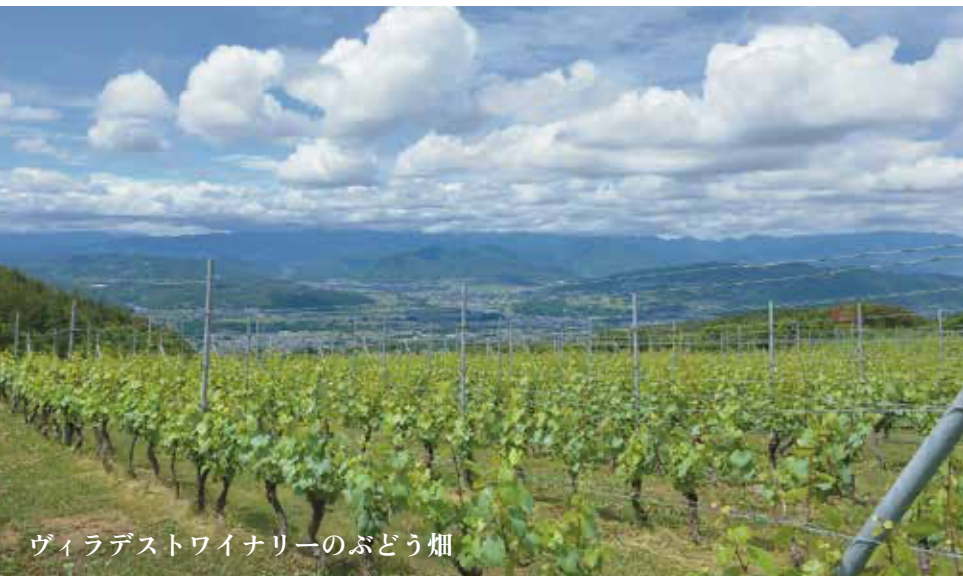
ヴィラデストワイナリーのぶどう畑