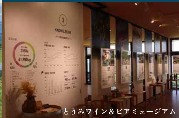
とうみワイン&ピアミュージアム